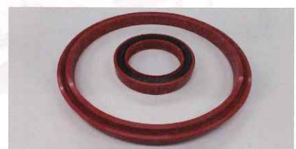
シールジェット加工