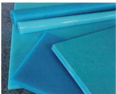
エンジニアリングプラスチック素材