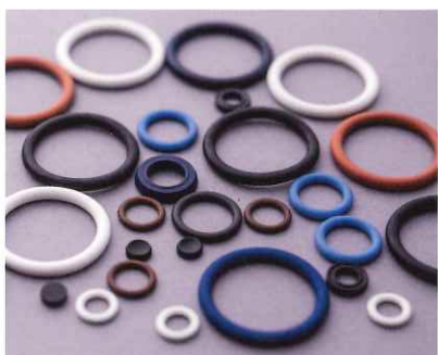
ゴム成型品 Oリング