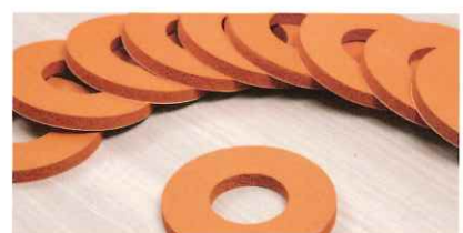
トムソン型めき加工