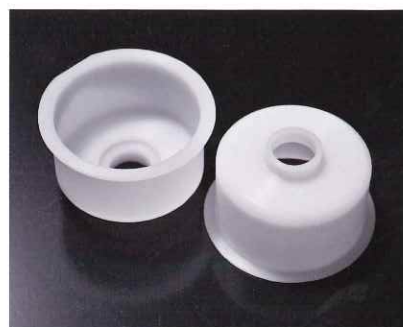
プラスチック成型品