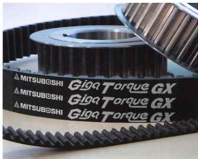
伝導用ベルト & プーリー

平間ゴム機材は、Oリング、指サック、オイルス製品、ベルトなど 工業用ゴム製品やプラスチック製品の多種ラインナップを取り揃えています。