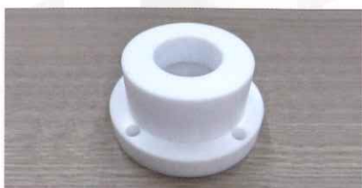
テフロン切削加工