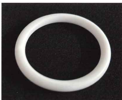
プラスチック切削加工品