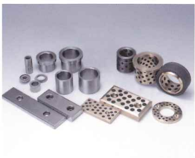
オイルス軸受け製品