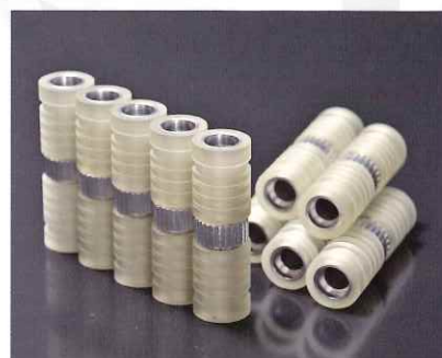
ゴムローラー・ライニング