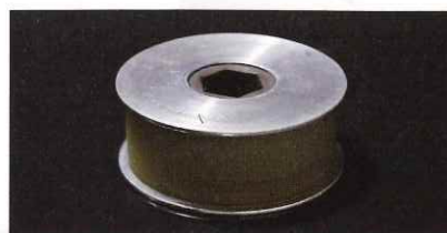
ゴムライニング加工